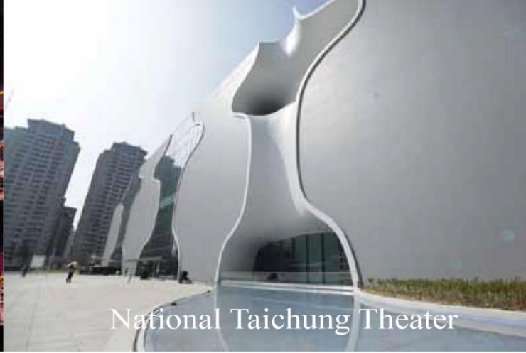
National Taichung Theater